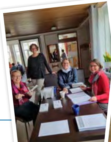
Wahlvorstände in St. Jakobus (links) und St. Marien (rechts).

Allen ausscheidenden und allen, die weitermachen, so wie den neuen Mitwirkenden sei herzlich für ihr Engagement gedankt!