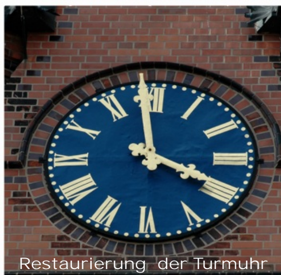
Restaurierung der Turmuhr